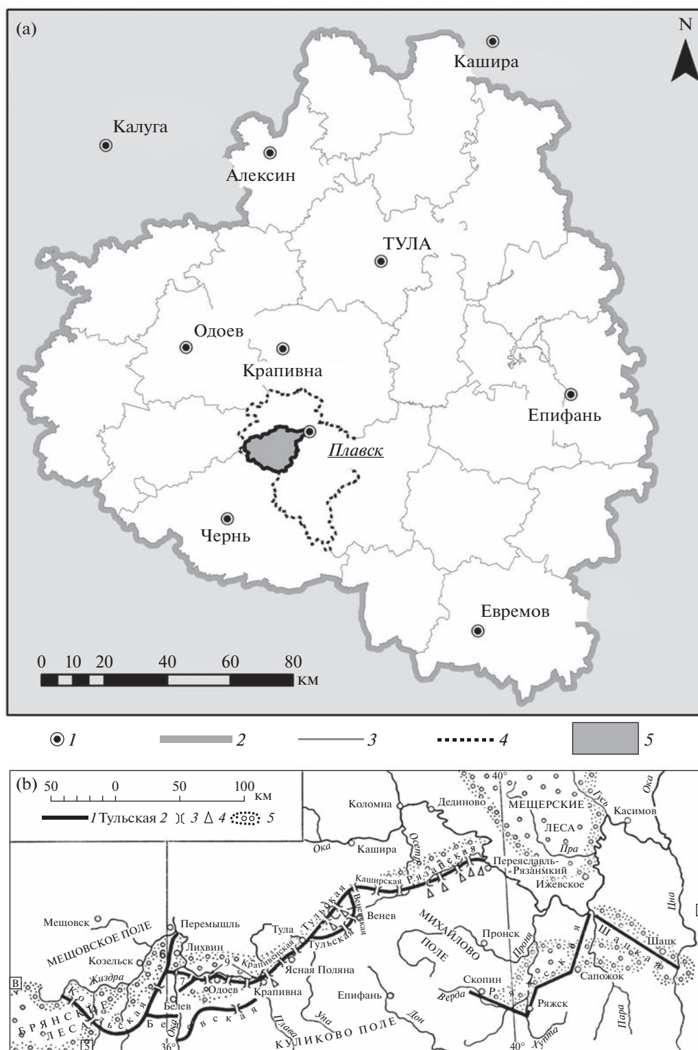
Рис. 1. Местоположение района исследований (а): 1 – населенные пункты, 2 – граница Тульской области, 3 – границы районов, 4 – граница Плавского района, 5 – бассейн р. Локна. Расположение участков засечной черты в XVII в. (б): 1 – Большая засечная черта, 2 – названия засек, 3 – ворота в засеках, 4 – крепостцы, 5 – леса (по [47]).