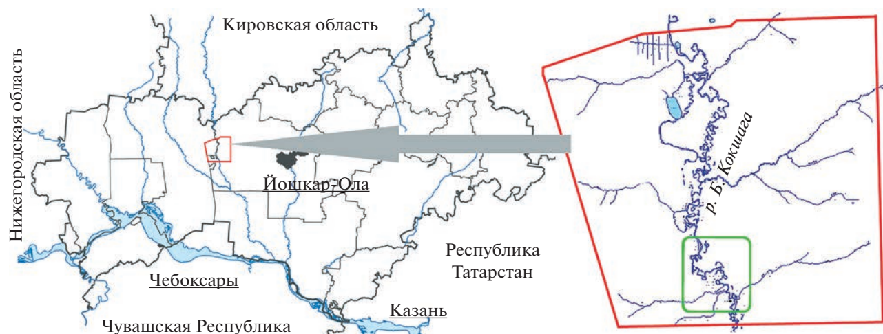
Рис. 1. Расположение заповедника “Большая Кокшага” на территории Республики Марий Эл (слева) с указанием мест отбора проб почвы (справа), выделенных квадратом.

Это сходство обусловлено, по нашему мнению, однотипным генезисом луговых и перегнойно-глеевых почв, которые формировались из сходного по валовому и гранулометрическому составу аллювия с той лишь разницей, что последние в настоящее время заболочены. Иловато-торфяные почвы достоверно не отличаются от перегнойно-глеевых по концентрации в них P, Zn, Ni, Cu и Rb.